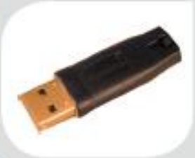
USB paměťový disk Kód 799 350 622