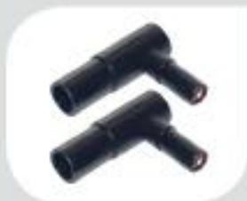
Adaptér 4.0 úhlový, černý, Kód 799 350 340 rovný, černý, Kód 799 350 461 Adaptér 4.7 úhlový, šedý, Kód 799 350 341 rovný, šedý, Kód 799 350 462