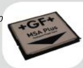
Paměťová karta 32 MB pro 1700 záznamů Kód 799 350 621