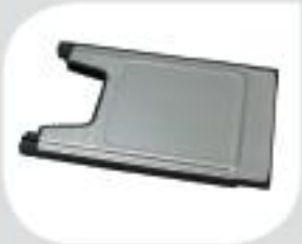
Adaptér - karta PCMCIA-CF Kód 799 350 623