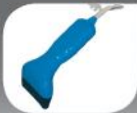
Čtecí scanner včetně pouzdra MSA PLUS 250 - 400 Kód 799 350 419