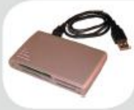
Čtečka paměťových karet Kód 799 350 620