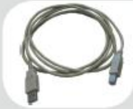
USB kabel Kód 799 350 619