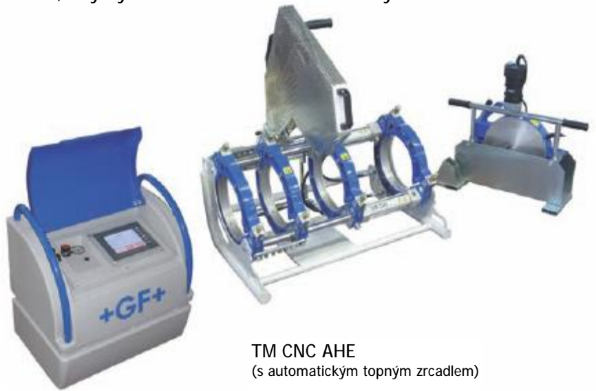
TM CNC AHE (s automatickým topným zrcadlem)

Protokoly o svarech, stejně jako informace o svářečovi, číslo zakázky nebo zpětná sledovatelnost jednotlivých svařených dílů, jsou ze strany investorů požadovány čím dál více. Svářečky typů TM CNC a TM WR umožňují záznam svarů a vedou svářeče v průběhu celé přípravy svaru a během celého svařovacího procesu tak, aby bylo dosaženo maximální kvality svaru.