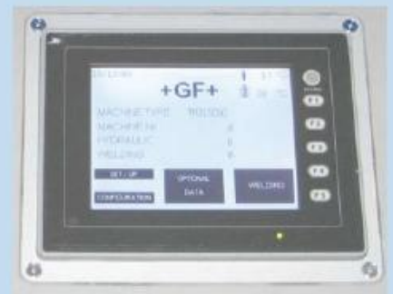
TM CNC - displej

Svářečky TM CNC vedou svářeče krok po kroku celou přípravou svaru včetně samotného svařovacího procesu pomocí symbolů a grafiky. Výběr a vkládání svařovacích a jiných dat (norma, materiál, dimenze, SDR, číslo svářeče, zpětná sledovatelnost podle ISO 12176-4) se provádí prostřednictvím dotykové obrazovky. Svařovací parametry - teplota, tlak a čas - jsou automaticky vypočítány, nastaveny a kontrolovány v souladu se zvolenými národními předpisy. Pro nestandardní dimenze je k dispozici 10 programovatelných slotů. Další mnohé konfigurace, jako např. zkrácení doby chlazení (funkce CTC - Cooling Time Control), automatická kontrola tvoření výronku ve fázi orovnění, zadávání souřadnic GPS, vkládání dat (číslo svářeče, zpětná sledovatelnost apod.) jsou možné zadávat prostřednictvím scanneru (čárový kód). Samozřejmostí je také komunikace v mnoha jazycích včetně češtiny. Protokoly o svarech lze exportovat na klasický USB disk, který je dodáván spolu se svářečkou, stejně jako program pro práci s protokoly SUVI WIN-WELD. Modely TM 250 CNC a 315 CNC jsou také k dispozici ve verzi s automatickým topným zrcadlem (AHE - Automatic Heating Element).